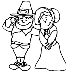
Des « pèlerins »