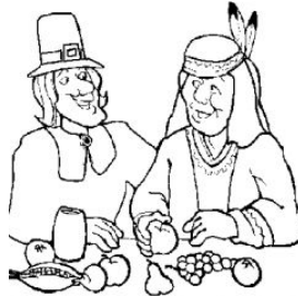
Sauvés par les indiens